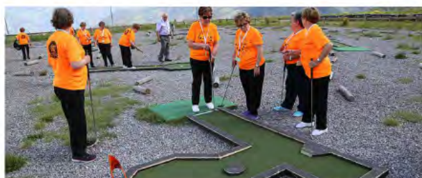
Golf i proves de destresa