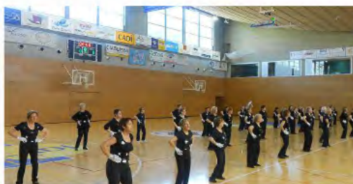
Balls en línia