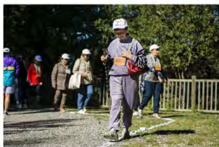
Marxa i orientació