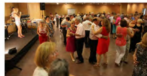
Balls de saló