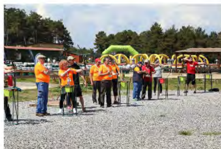
Tir amb arc